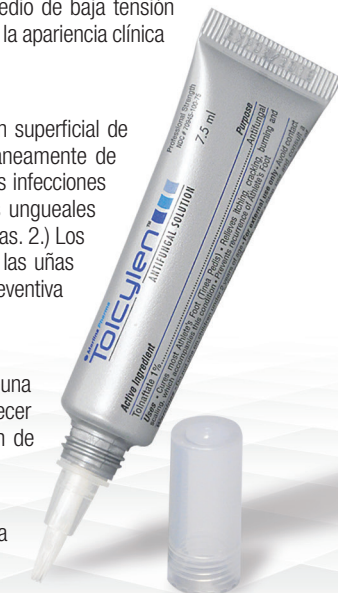
Punta Aplicadora Tru-Flow™

Todos los ingredientes de Tolcylen® son considerados seguros (GRASE) por la FDA y no contienen: benzoatos, BHT/BHA, DMSO, Gluten, Parabenos, o PHMB.